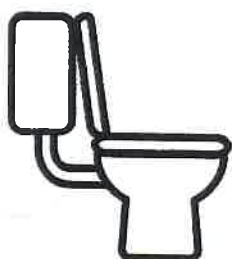
Säga till toa